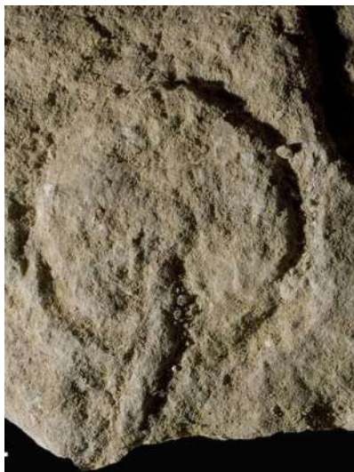
Vulvas. Abrigo de Castanet (Francia) . 37.000 años Periodo Auriniense

En la zona francesa durante la fase auriniense aparecen grabadas en abrigos rocosos numerosas muestras. Algunos ejemplos: