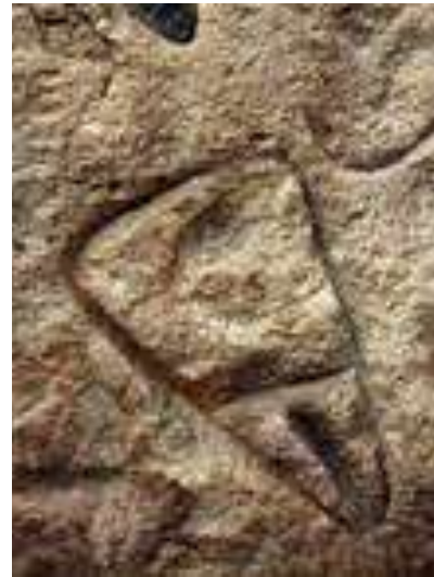
Vulva. Abrigo de La Ferrassie (Francia) . Datación no concretada.