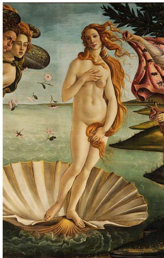
Representación de Venus como símbolo clásico de la Belleza. Detalle de "El nacimiento de Venus" de Sandro Botticelli.

Es necesario remarcar que este punto de vista estaba sesgado por la perspectiva masculina del momento y, a día de hoy, aunque el término Venus prevalece, se desliga por completo de la idea que lo asocia a un canon de belleza.