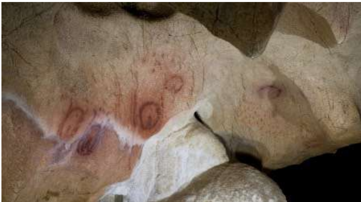
Camarín de las Vulvas en la cueva de Tito Bustillo (Asturias).

Las representaciones vulvares aparecen junto a otras agrupaciones de puntos y trazos lineales en rojo, y destaca sobremanera una pieza que se incluye dentro de un perfil humano.