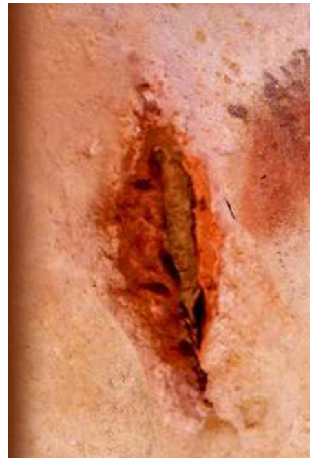
Vulva en cavidad natural de la cueva de Ekain (País Vasco).