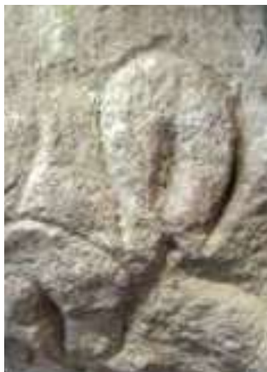
Vulvas. Abrigo de Cellier (Francia) . Periodo Auriniense