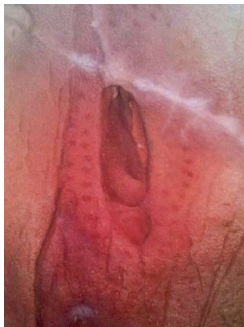
Vulva en cavidad natural de la cueva de Chufín (Cantabria).

Es indiscutible el impacto visual que se alcanza en los ejemplos que utilizan el propio soporte natural para concretar la simbología sexual